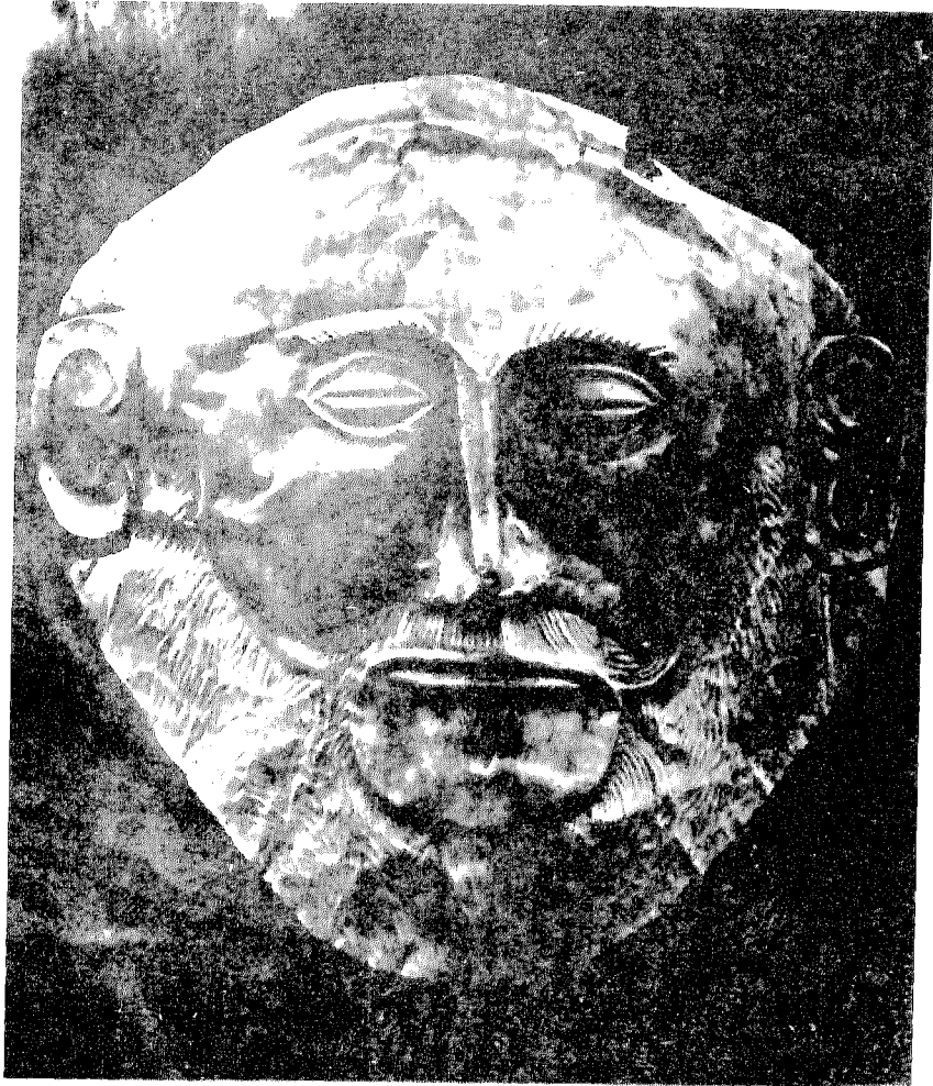
شكل ٢ - قناع من الذهب جاء من مقابر المجموعة الأولى - ويدعى قناع « اجاننون » .